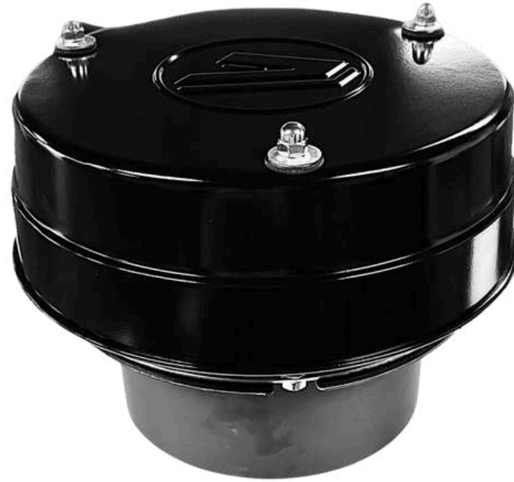
VPV - Emniyet Valfi VPV - Pressure Relief Valve